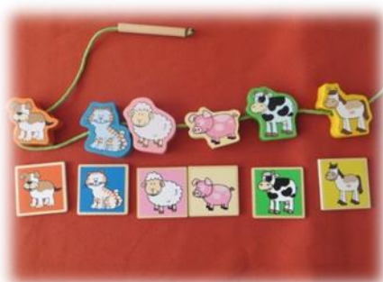
Спазване на последователност