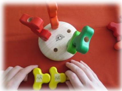
Учебна игра „Градина“

Основната задача е формиране на практически умения на учениците: разбиране и изпълняване на словесни указания; спазване последователност от действия; овладяване и затвърдяване на знания за цветове и форми; развитие на фината моторика, с изпълнение на дихателни и артикулационни упражнения и овладяване на количествена представа и понятия като: едно-много; повече-по-малко; голямо-малко; късо-дълго; ниско-високо; толкова-колкото. Формиране на умения за слуховото възприемане на текст, съчетано с двигателни имитации на словото и звукоподражания, овладяване на нови думи за построяване на изречения. Разработени са нови учебни символни игри: „Градина“, „Летящото влакче“, „Театър“ с различни нива на трудност.