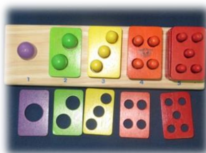
Съотнасяне по цвят и количество